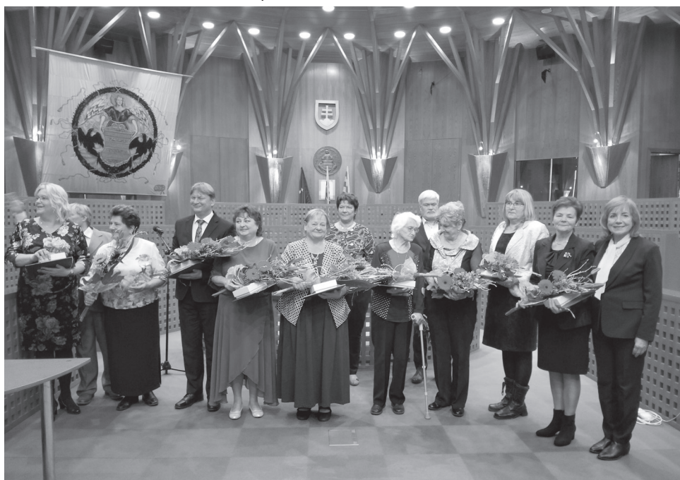
Spoločná fotografia ocenených

oficiálnych autorít je v kríze... Lenže človek má okrem uší aj srdce. Hoci často o čomkoľvek počujeme všeličo, náš cit nám napovie. Emócia nás k niektorým ľuďom priťahuje, lebo s nimi harmonizujeme. Náš naturel, naša duša sa v ich prítomnosti cíti dobre, ich vyjadrovanie i konanie sa nám páči, zaujímate sa o ich názory, počúvame ich rady. Kompas v nás nesklame, ak sme sami vnútorne čistí a pozitívne naladení alebo aspoň sa o to úprimne snažíme.