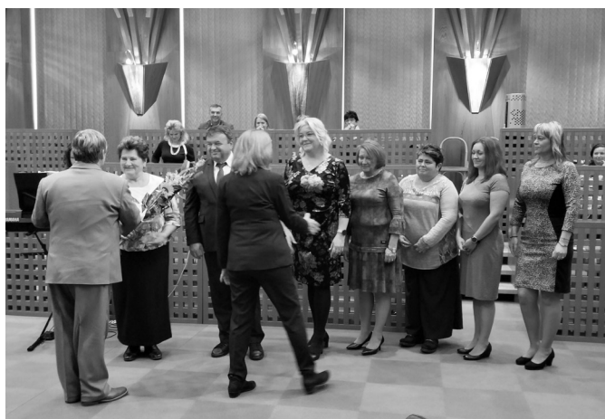
Kolektív ZPOZ Jelšava